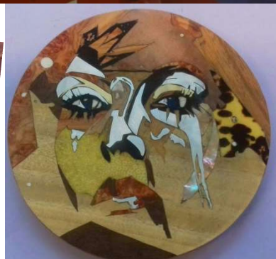
Exercice sur les matériaux