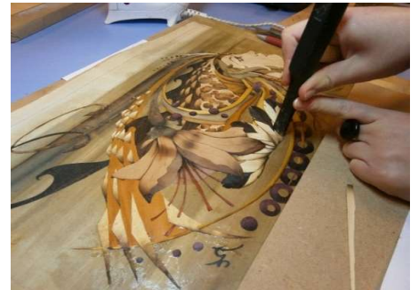
Incrustation sur cale tendue

Les ateliers bois sont ouverts toute la semaine aux élèves qui souhaitent travailler sur leurs projets de concours ou autres.