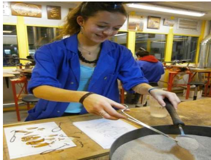
Ombre au sable chaud