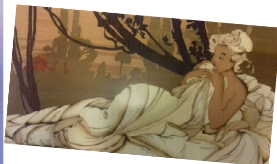
Marqueterie de bois