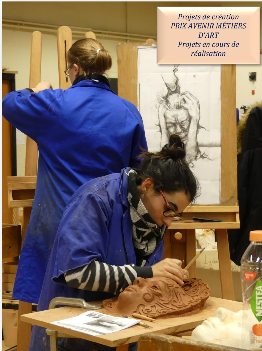
Projets de création PRIX AVENIR MÉTIERS D'ART Projets en cours de réalisation