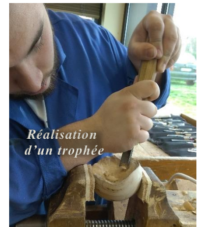
Réalisation d'un trophée